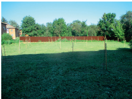
Благоустройство сквера у домов №1, 2, 19 с. Федино и посадка 30 лип