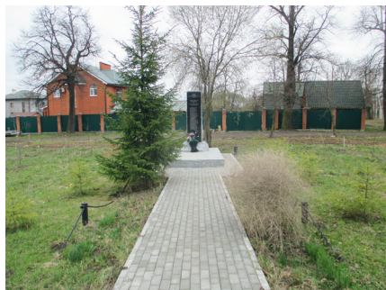
Памятник в с. Константиново