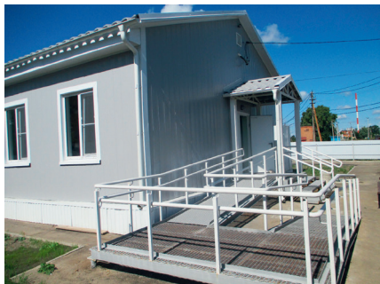
ФАП д. Степанцино