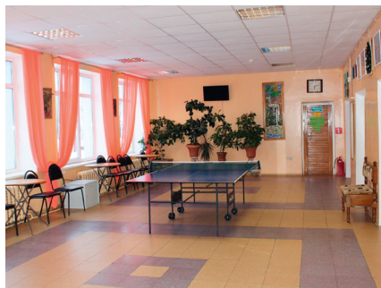
Дом культуры деревни Ратчино