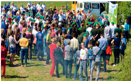
2018 год - акция «Лес Победы» у д. Максимов- ка – было посажено 8000 саженцев сосны