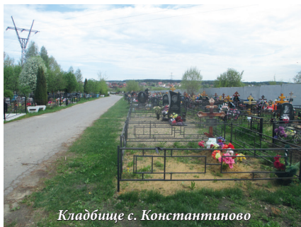
Кладбище с. Константиново