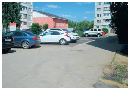
Благоустройство двора с. Федино – дома № 7, 8