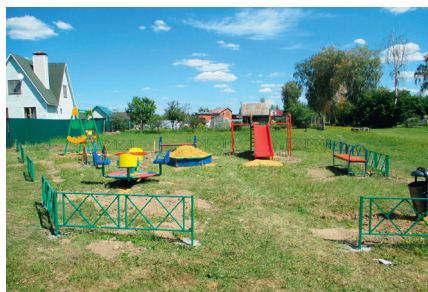
Детская площадка в с. Петровское