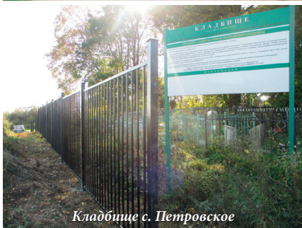
Кладбище с. Петровское