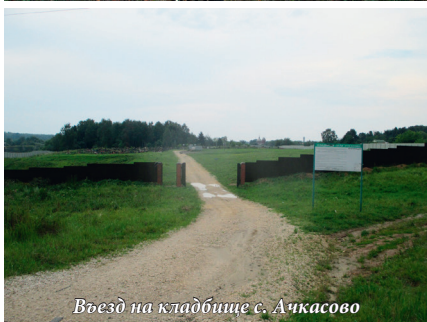
Въезд на кладбище с. Ачкасово