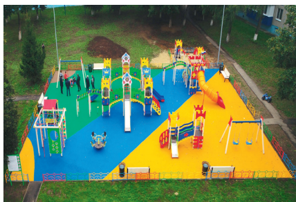
Благоустройство двора с. Косяково, ул. Юбилейная – дома № 1, 2, 3, 4, 5