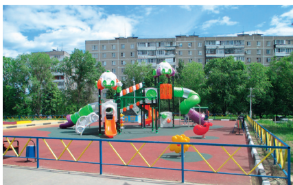
Детская площадка у ТЦ «Карусель», ул. Фединская