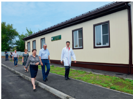
ФАП с. Ачкасово

В сельском поселении Фединское 3 амбулатории и 4 фельдшерско-акушерских пункта (ФАП). По областной программе, построены и пущены в работу новые ФАПы в с. Ачкасово и д. Степанцино с необходимым оборудованием и трехкомнатной квартирой для врача. Строится ФАП в с. Невское.