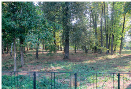
Благоустройство парка село Ачкасово