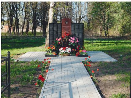
В с. Косяково установлен новый памятник за счет бюджета поселения (500 тыс.руб.)