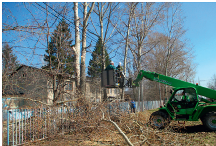
Работа МКУ «Благоустройство»