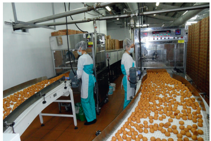
Кондитерская фабрика ООО «ГранЪ»