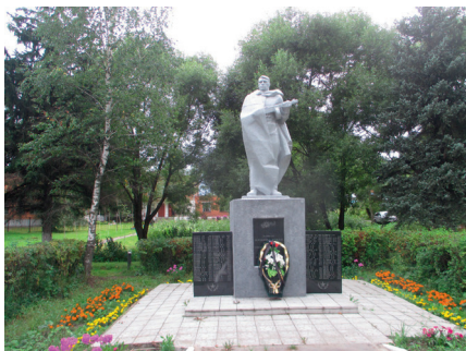
Памятник в д. Степаницино

К 70-летию Победы в Великой Отечественной войне все памятники погибшим воинам были приведены в порядок, установлены новые мраморные плиты с именами погибших, выложена тротуарная плитка, произведен капитальный ремонт постаментов, облагорожены территории.