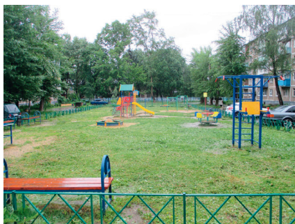
Благоустройство двора с. Федино – дома № 12, 13, 14