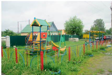
Детская площадка в д. Ратмирово