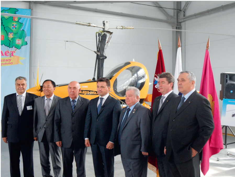
Прошедший в Фединском поселении «Авиарегион-2014» - первый в истории страны авиасалон малой и региональной авиации, показал, что у ООО «Агро Авиа Воскресенск» большие перспективы

Среди предприятий за спонсорскую помощь в развитии поселения хотелось бы поблагодарить руководителей ООО «ГранЪ», ООО «Эрисман», ООО «ВоскресенскПром», «Промсервис-С», АТК -14, ООО «ТЦ-Девелопмент», ООО «Эй-Джи Строймаркет», ОАО «Воскресенское», ООО «Родина», ООО «Дедал», Воскресенского кирпичного завода, ИП «Пигорева О.Ю.», ИП «Протопопов» и многих других.