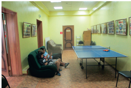
Клуб деревни Степанищи