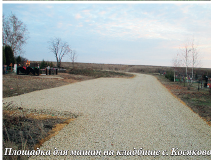
Площадка для машин на кладбище с. Косяково