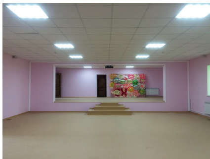
Клуб д. Городище

В клубах поселения ведут работу 50 клубных и 8 спортивных формирований, с числом участников около 900 человек. Все формирования работают на бесплатной основе.