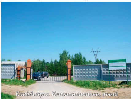
Кладбище с. Константиново, въезд

На территории поселения 10 кладбищ. За 5 лет за счет бюджетов поселения и района все кладбища благоустроены: 5 полностью огорожены заборами, ко всем сделаны подъездные пути, на всех установлены мусоросборочные площадки и емкости для воды, установлены информационные стенды. С 1 января 2015 года кладбища поселения качественно обслуживает МУП «Ритуал» Воскресенского района.