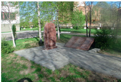
Памятник в с. Федино