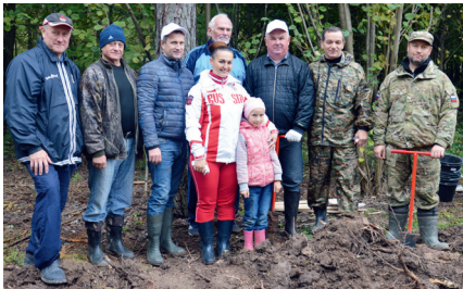
2016 год – акция «Лес Победы», у д. Скрипино было посажено 4000 саженцев сосны