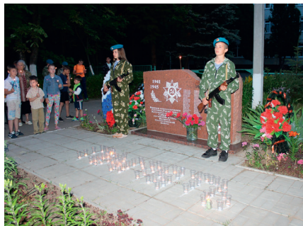
Памятник в д. Ратчино