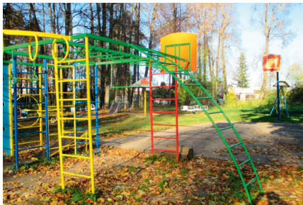
Детская площадка в с. Ачкасово