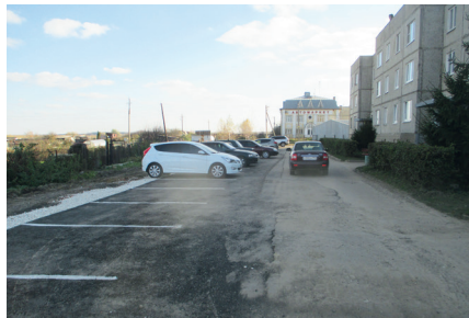
Благоустройство двора д. Степаничино, ул. Суворова – дома № 1, 2, 3, 4