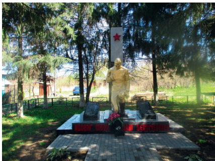
Памятник в с. Петровское