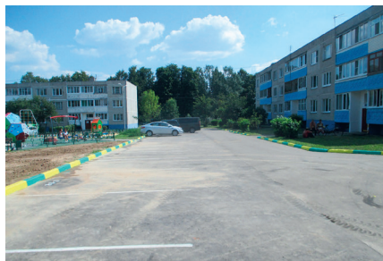
Благоустройство двора д. Ратчино, ул. Некрасова – дома № 2, 3, 4, 5, 16, 17, 18

За 5 лет, кроме 6-ти детских площадок, в выше указанных дворах, в поселении установлено еще 6 новых детских площадок и добавлены новые игровые элементы на существующие за счет оплаты из различных источников.