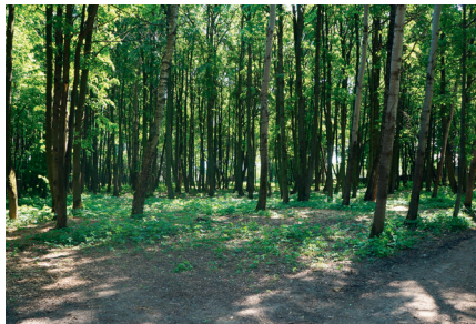
Благоустройство парка д.Ратчино