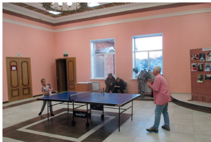
Дом культуры села Косяково