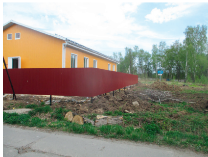
ФАП с. Невское