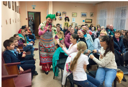
Сельский клуб с. Марчуги