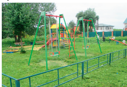
Детская площадка в с. Константиново

За 5 лет, кроме 6-ти детских площадок, в выше указанных дворах, в поселении установлено еще 6 новых детских площадок и добавлены новые игровые элементы на существующие за счет оплаты из различных источников.