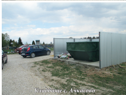
Кладбище с. Ачкасово