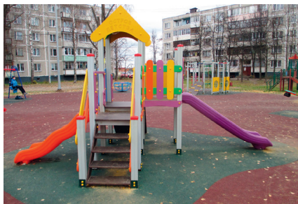
Благоустройство двора с. Федино – дома № 15, 16, 17