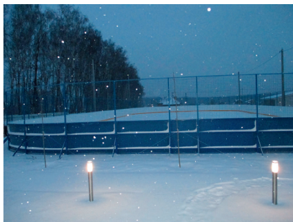
ДНТ «Солнечный берег»

Ежегодно организуемый чемпионат по хоккею среди любителей на приз Главы сельского поселения Фединское стал популярным не только в Воскресенском районе, но и за его пределами. Так в сезоне 2017-2018 года в чемпионате участвовало 14 команд, которые сыграли 91 игру. Победителями стала команда пос. Фосфоритный, 2 место – с. Федино, 3 место - д. Ратчино.