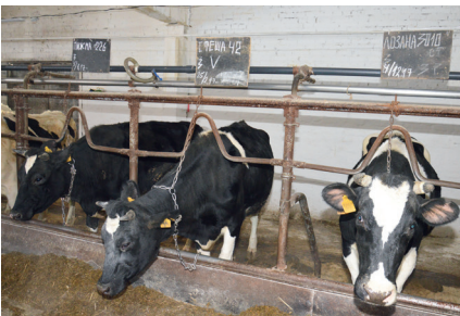
Ферма ОАО «Воскресенское»