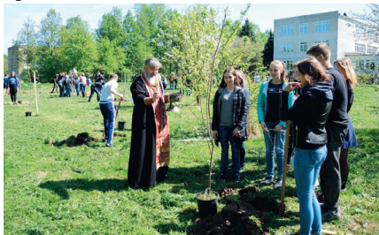
2018 год - акция «Сад Победы» на территории Ратчинской школы, посажено 50 яблонь