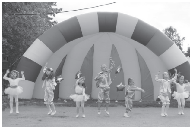
Выступление танцевального коллектива «Солнышко»

По задумке организаторов праздника основной идеей праздника стало «зажигание» больших и ярких звёзд в честь местных жителей, благодаря которым деревня живёт и процветает. Со сцены чествовали педагогический коллектив Степанщинской средней общеобразовательной школы, сотрудников детского сада «Ручеек», работников местного медпункта, а также молодоженов, родителей новорожденных, ветеранов, юбиляров, которые отметили в этом году 70, 75, 80 и 85 лет. Не забыты были и «старожилы» - старейшие жители деревни. После каждого поздравления следовала душевная песня - подарок от артистов Воскресенского района и участников художественной самодеятельности сельского клуба д. Степанщино. Приятно было смотреть на