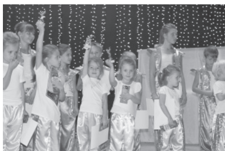
Танцевальный коллектив «Фантазеры»

13 сентября работники Дома культуры д. Ратчино пригласили жителей деревни и гостей разделить радость и приятное волнение от начала творческого сезона 2015-2016 г.