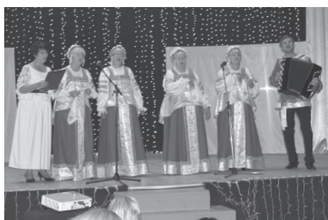
Хор ветеранов «Родные напевы»

Зрителям в концертной программе «И снова здравствуйте!» были представлены самые интересные и яркие номера из обновленного репертуара творческих коллективов: детского танцевального «Фантазеры», вокального «Музыкальная палитра», хора ветеранов «Родные напевы». Порадовали своим выступлением и участники спортивного кружка «Пересвет», которые показали элементы кросс-фита на сцене. Шахматный клуб «Три слона» пригласил всех желающих на шахматный турнир, который состоялся перед началом концерта, а от кружка «Умелые ручки» была подготовлена выставка лучших работ.