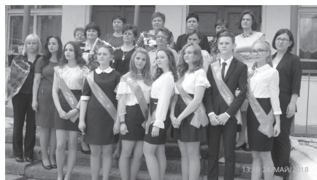
Выпускники СОШ Степанино (9 класс)