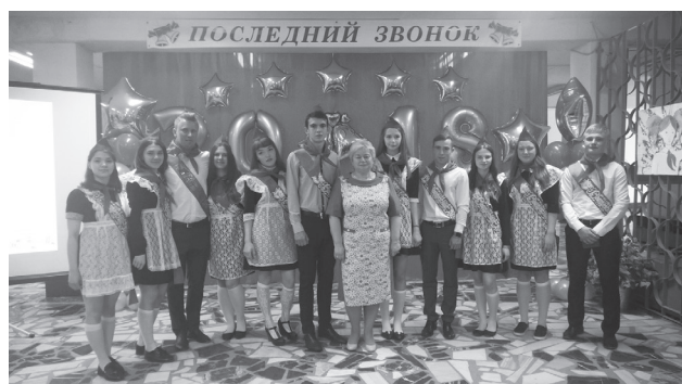
Выпускники СОШ с. Федино (11 класс)