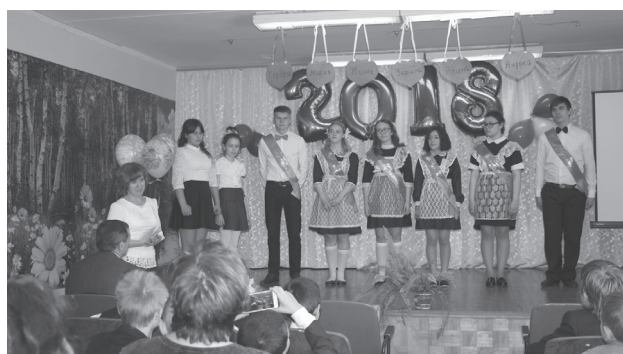
Выпускники СОШ с.Косяково (9 класс)